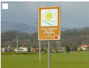
Parco dei colli in festa nel finesettimana

Fiere incontri e feste Ecco il tuo lungo weekend