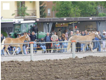
Un'immagine di una passata edizione di Treviglio cavalli

Fiere incontri e feste Ecco il tuo lungo weekend